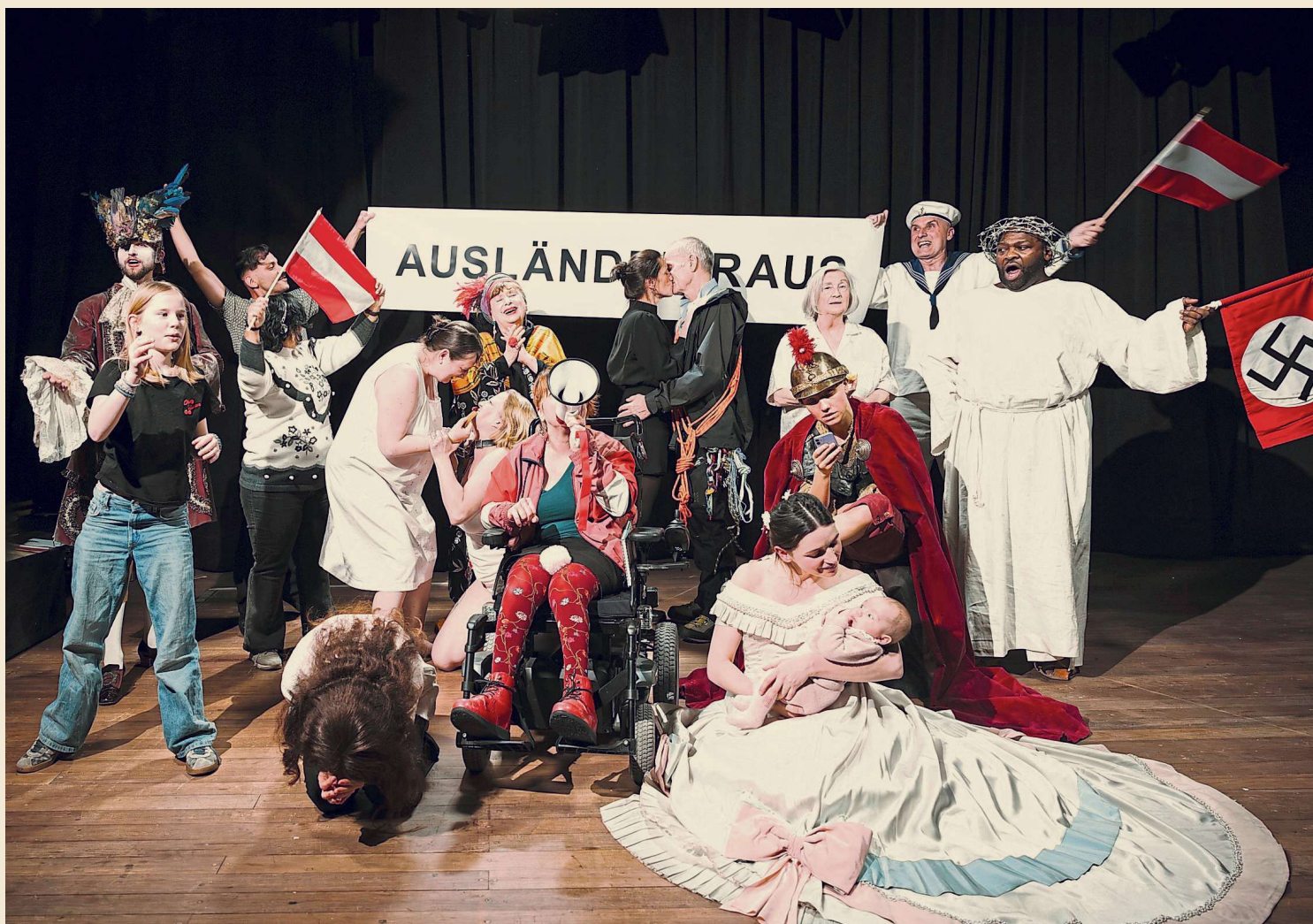
25 gecastete Personen tun ihre Erinnerungen an 75 Jahre Wiener Festwochen kund – im Stück „Das beste Stück aller Zeiten“.

Dafür bietet Milo Rau hier reichlich Gelegenheit. So sind fast alle in der Stadt, ob Zugereiste oder nicht, echte Wiener. Die gehen nicht unter, daran glauben sie. Deswegen heißt es in der Triggerwarnung beim „besten Stück“, es „enthält Darstellungen von Gewalt“ und „thematisiert Tod“. Wienerischer geht's nimmer. Museumsquartier Halle E, 15., 17.–20. Mai, jeweils 19.30; 22. Mai, 18 Uhr